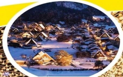
ชิราคาวาโกะ