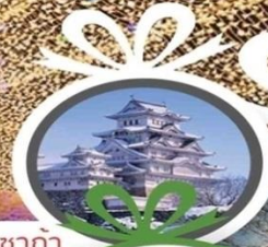
ปราสาทโศซาก้า