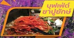
บุฟเฟต์ ซาบูยักซ์